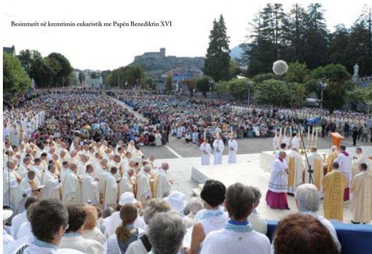
Besimtarët në kremtimin eucaristik me Papën Benediktin XVI

drite e lutjeje, shprese e kthimi në rrugën e Hyjit, ngritur mbi shkëmbin e dashurisë së Zotit, që arriti kulmin e dëftimit në Kryqin e lavdishëm të Krishtit. Në shkollën e Marisë, nxënësjë e parë dhe e përkryer e të Kryqëzuarit - vijoi Benedikti XVI - shtegtarët mësojnë t'i shikojnë kryqet e jetës së tyre, pikërisht në dritën e Kryqit të lavdishëm të Krishtit. Zoti na deshi aq, sa të jepte vetveten për ne: ky është mesazhi i Kryqit 'mister i vdekjes e i lavdisë'. Kryqi na kujton se nuk ka dashuri të vërtetë, pa vuajtje, se nuk mund të dhurosh jetën, pa dhimbje. Shumëkush e mëson këtë në Lurdë, që është shkolla e dashurisë në shërbim të vëllezërve".