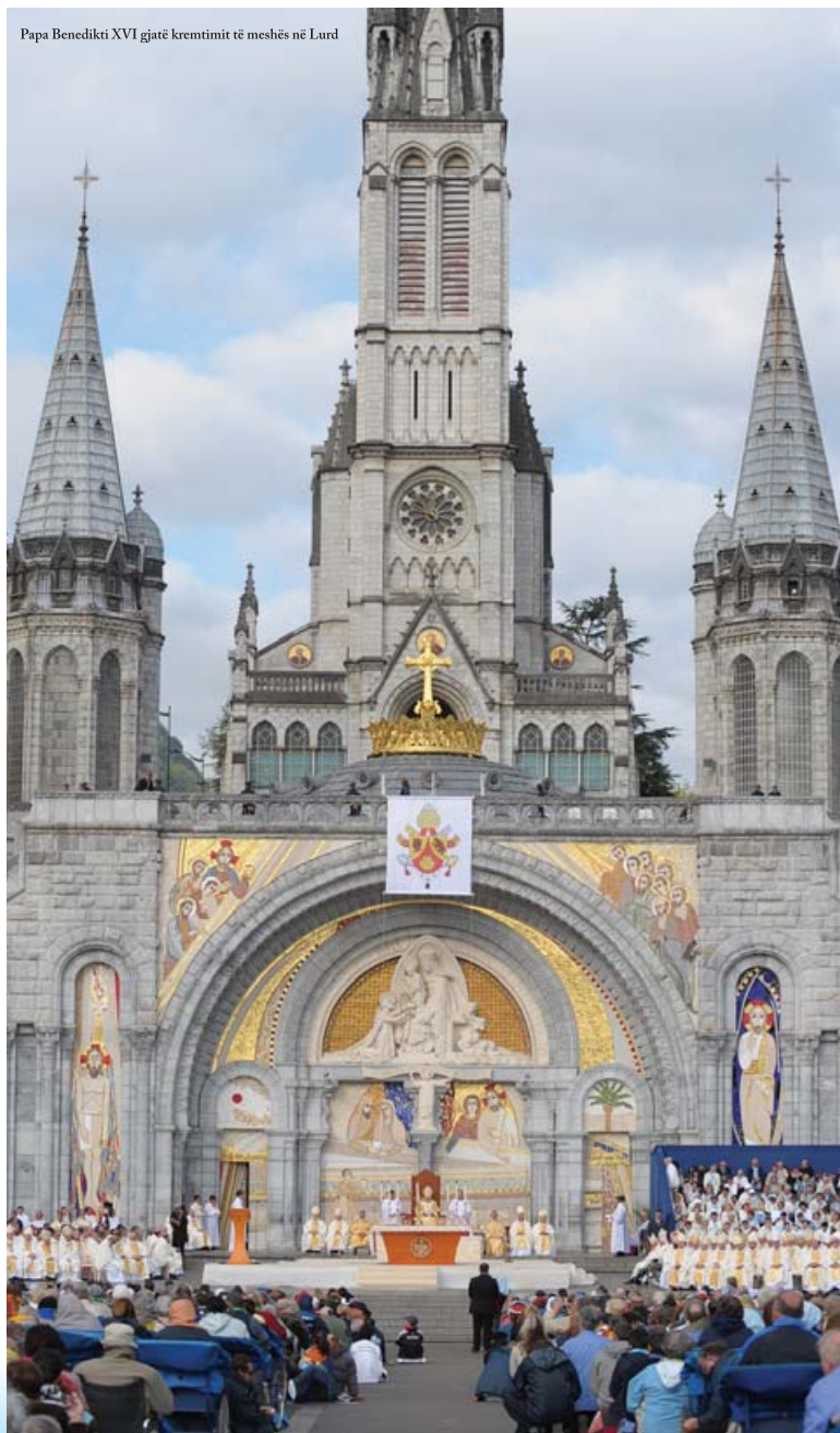
Papa Benedikti XVI gjatë kremtimit të meshës në Lurd

Vizita apo më mirë të thuhet shtegtimi i papës Benediktit XVI në tokën franceze, me rastin e 150-të vjetorit të dukjeve të Zojës së Bekuar në Lurdë, pothuajse nga të gjithë ata të cilët e përcollën me vëmendje këtë udhëtim, është konsideruar si shumë pozitiv dhe frytdhënës për popullin dhe Kishën në Francë e më gjerë.