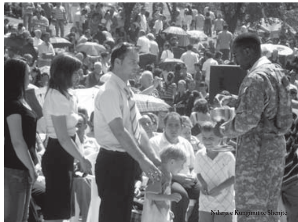
Ndarja e Kungjit të Shenjtë