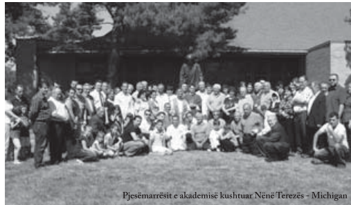
Pjesëmarrësit e akademisë kushtuar Nënë Terezë - Michigan