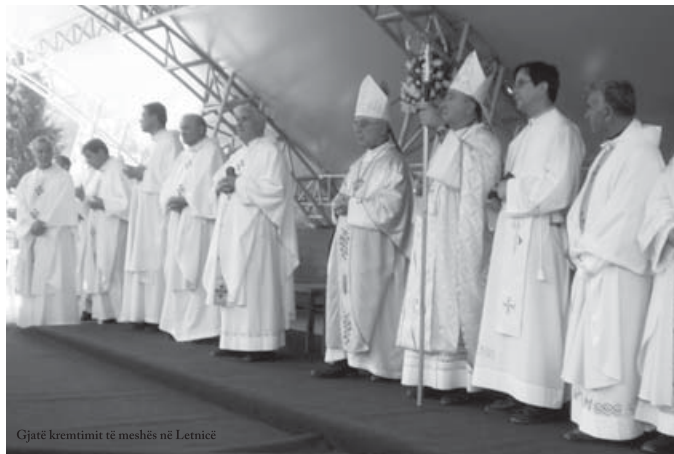
Gjatë kremtimit të meshës në Letnicë

Edhe ditën e festës, procesioni ishte me truporën e Zojës Bekuar, dhe më pas festimi u përmbyll me bekimin solemn. (Don Agim Qerkin)