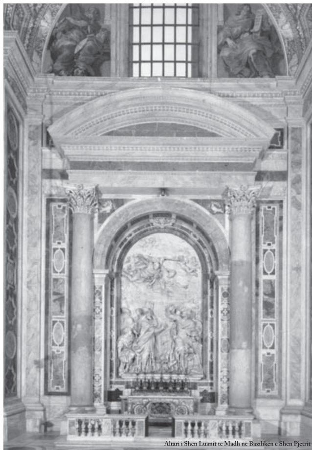
Altari i Shën Luanit të Madh në Bazilikën e Shën Pjetrit

Ashtu veproni edhe kundër priscilianëve në Spanjë më 21 qershor të vitit 447. Për në është e nevojshme të thuhet se papa Inocenti I dhe papët e mëparshëm, dëshironin të shtrinin dhe vërtetonin të drejtën e vet në mbarë Ilirikun. Papa në fjalë shpalli Selanikun si metropolitin, duke dashur që në këtë mënyrë të zbutë ndikimin që kishte Patriarku i Konstantinopolit. Për këtë gjë, papa Luani ua shkroi një letër të gjithë ipeshkvijve dhe u shpjegoi se Pjetri apostull ishte i pari duke e udhëhequr Kishën në tërësi. Për këtë të gjitha pyetje diskutabile, duhet të zgjidhen në Romë e jo në Konstantinopol. Ky arriti t'i bindë për të qenë Roma qendër e katolicizmit, por pas vdekjes së tij prapë filluan mosmarrëveshjet.