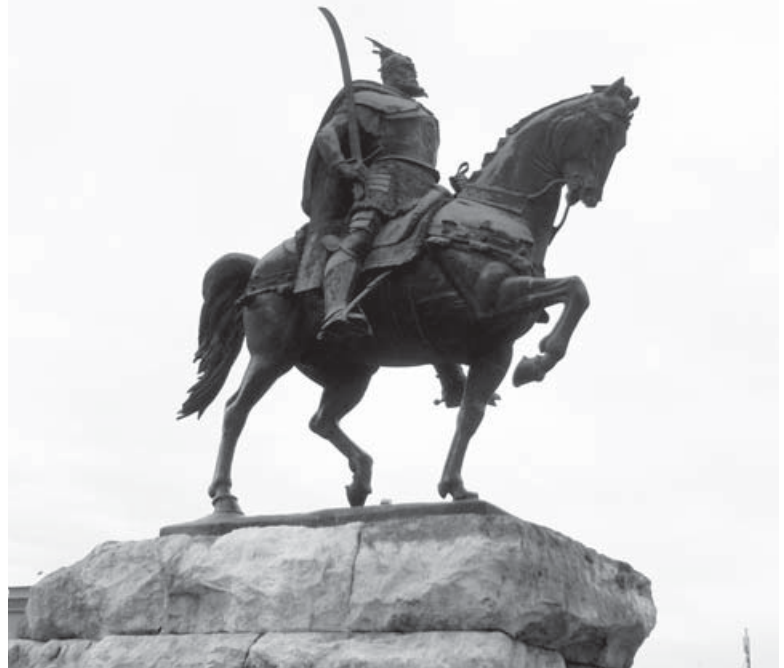
Statuja e Skenderbeut në Tiranë