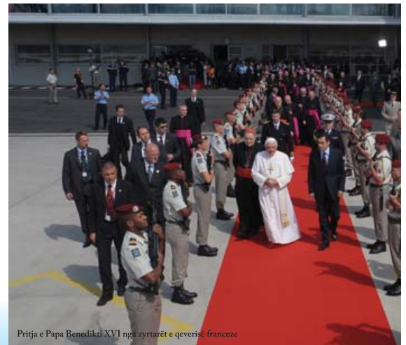
Prijta e Papa Benedikti XVI nga zyrtarët e qeverisë franceze

Papa ka rinxjerrë në pah shprehjen 'laicitet pozitiv', të përdorur nga vetë presidenti Sarkozy gjatë vizitës së tij në Romë para disa muajve.