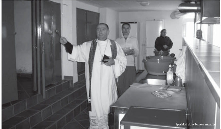
Ipeshkvi duke bekuar menzë

ipeshkvit, ky projekt u realizua pranë kishës së Shna Ndout në Prishtinë, dhe më 20 shtator 2008, ipeshkvi, në prani të meshtarëve, motrave dhe mysafirëve tjerë e bëri bekimin e saj. Ndër tjera, në fjalët e rastit ipeshkvi uroi që kjo menzë të jetë një strehë për njerëzit e varfër,