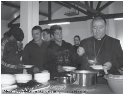
Mons. Doda duke bashkëndarë ushqimin me të varfërit

Falë Zotit, bamirësve dhe angazhimit personal të