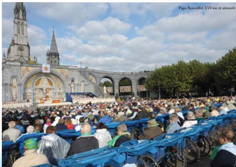
Papa Benedikti XVI me të sëmurët

Në fushën e edukimit Kisha ka një hapësirë mjaft të madhe, shkollat për fëmijë e fillores janë 7113, ato të mesme 2726 dhe universitetet 356. Studentët që marrin pjesë në këto shkolla janë më shumë se 2 milion: 833 mijë në shkollat fillore, 1 milion e 200 mijë në të mesmet dhe 56 mijë në lami e ndryshme akademike. Kisha në Francë ka të vetat 94 spitale, 103 ambulanca, 520 strehimore për pleq, 96 strehimore për fëmijë dhe 247 qendra për edukim shoqëror.